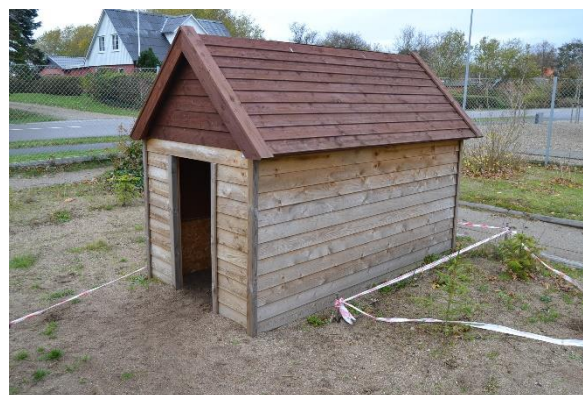
Redskab: Legehus Årgang: 2014/2020 Producent: Egen produktion Er redskabet mærket: Ja Emne 6: Er der registreret fejl/mangler: Nej