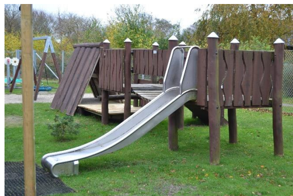
Redskab: Legetårn m. rutsjebane Årgang: 2010 Producent: Rudeco a/s Er redskabet mærket: Ja Emne 14: Er der registreret fejl / mangler: Ja