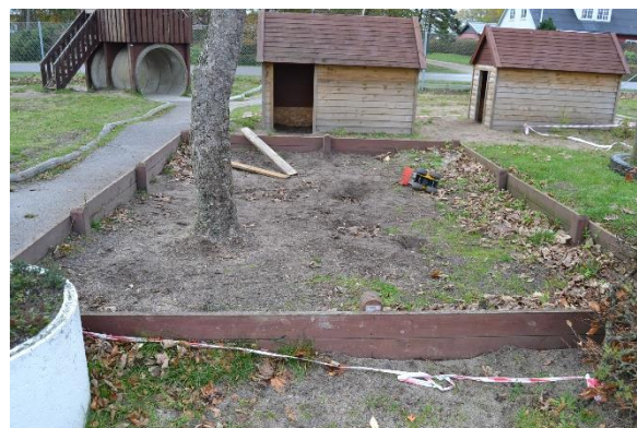
Redskab: Sandkasse Årgang: 2017 Producent: Egen produktion Er redskabet mærket: Ja Emne 4: Er der registreret fejl / mangler: Nej