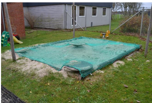
Redskab: Sandkasse Årgang: 2018 Producent: JRJ Ribe Er redskabet mærket: Ja Emne 17: Er der registreret fejl / mangler: Nej