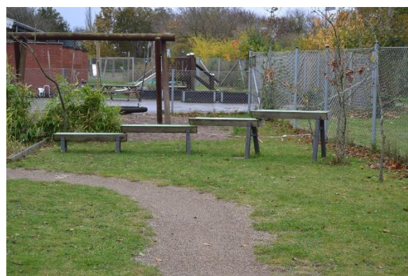
Redskab: Vandleg Årgang: Producent: Er redskabet mærket: Nej Emne 10: Er der registreret fejl / mangler: Ja