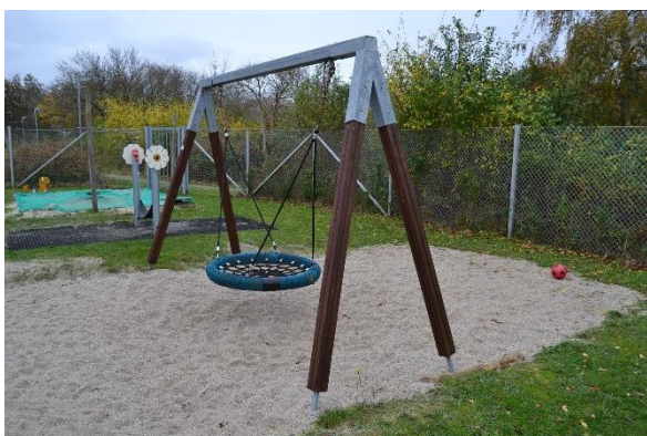
Redskab: Fugleredegyng Årgang: Producent: Er redskabet mærket: Nej Emne 15: Er der registreret fejl / mangler: Ja