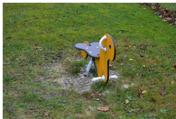
Redskab: Vippe Årgang: 2018 Producent: Kompan Er redskabet mærket: Ja Emne 18: Er der registreret fejl / mangler: Nej