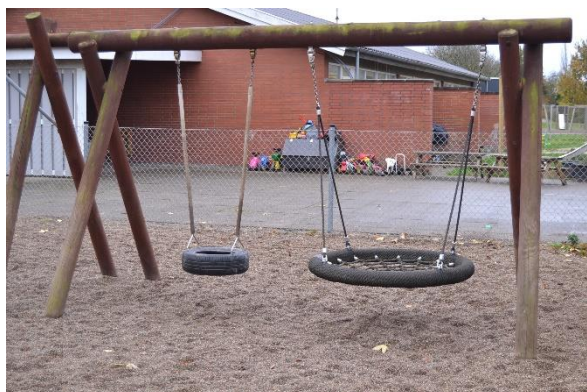
Redskab: Gyngestativ Årgang: Producent: Er redskabet mærket: Nej Emne 11: Er der registreret fejl / mangler: Ja