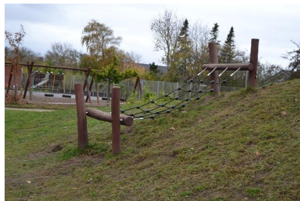
Redskab: Balancenet Årgang: 2017 Producent: Kompan Er redskabet mærket: Ja Emne 8: Er der registreret fejl / mangler: Nej