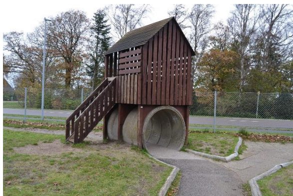
Redskab: Legetårn Årgang: Før 1998 Producent: Egen produktion Er redskabet mærket: Ja Emne 7: Er der registreret fejl / mangler: Nej