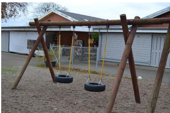
Redskab: Gyngestativ Årgang: 2008 Producent: Egen produktion Er redskabet mærket: Ja Emne 13: Er der registreret fejl / mangler: Ja