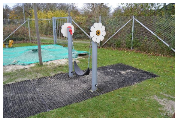
Redskab: Mavegyng Årgang: Producent: Kompan Er redskabet mærket: Ja Emne 16: Er der registreret fejl / mangler: Nej