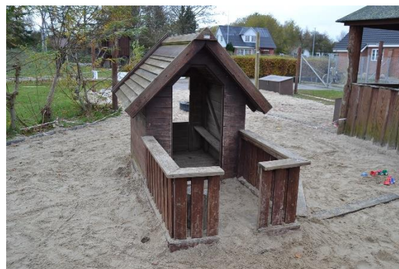
Redskab: Legehus Årgang: før 1998 Producent: Egen produktion Er redskabet mærket: Ja Emne 2: Er der registreret fejl / mangler: Ja