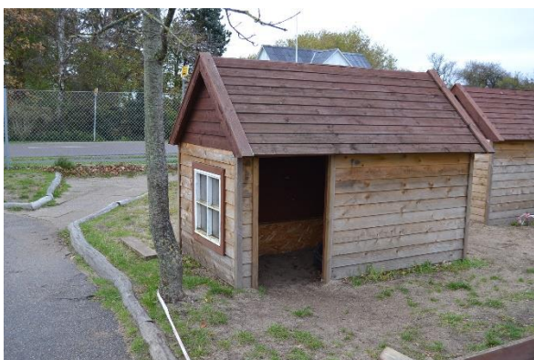
Redskab: Legehus Årgang: 2014/2020 Producent: Egen produktion Er redskabet mærket: Ja Emne 5: Er der registreret fejl / mangler: Nej