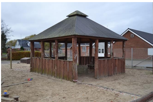
Redskab: Madpakke hus Årgang: Ikke omfattet af DS/EN 1176