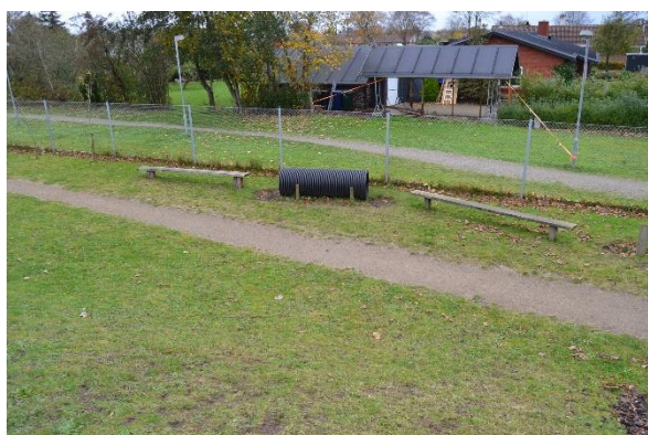
Redskab: Forhindringsbane Årgang: 2016 Producent: Egen produktion Er redskabet mærket: Ja Emne 9: Er der registreret fejl / mangler: Ja