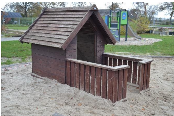
Redskab: Legehus Årgang: før 1998 Producent: Egen produktion Er redskabet mærket: Ja Emne 1: Er der registreret fejl / mangler: Ja