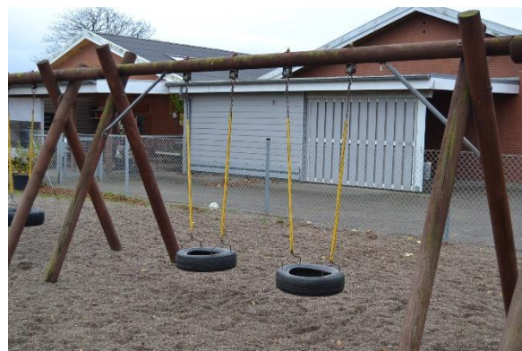
Redskab: Gyngestativ Årgang: Producent: Er redskabet mærket: Nej Emne 12: Er der registreret fejl / mangler: Ja